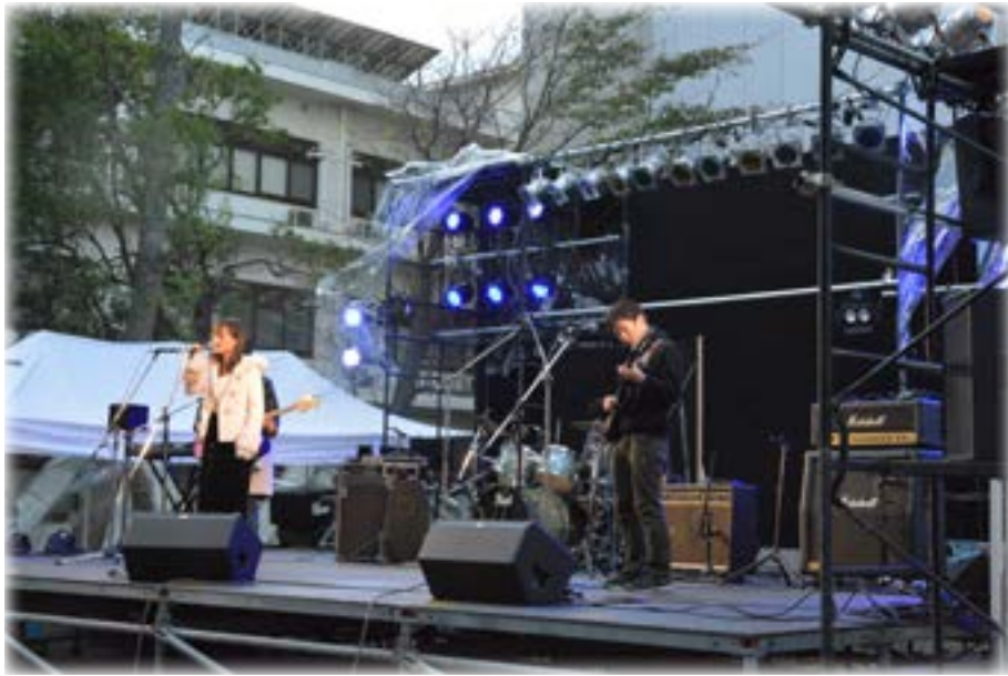
いちょうステージ